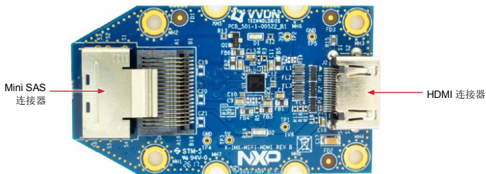
图 3：MIPI-DSI 至 HDMI 适配器卡（EVK 随附） 注：（适配器卡的颜色可能不同）